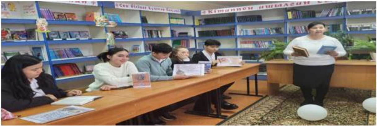
«Парасат- ақыл - мінез жарастығы» атты пікірлесу сағаты